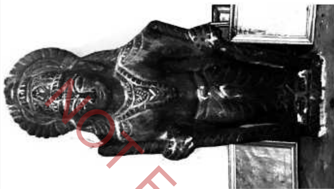
ஸ்ரீ வெங்கடேச மகராஜ் முதன்முதலாக பூஜை செய்த பக்கை திருமதி, நிரம்மா அணிகளின் முன்பணர், திரைக் கண்ட மகராஜ் அவர்களின் புனித லைக்குடியில், கம்பீரமாக நின்றவொன்றாகும் நோற்றம் ஆலயத்தின் முடிவாவியில் வைக்கப்பட்டுள்ளது.