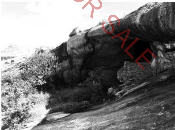
ஸ்ரீ வெங்குசா மகராஜ் அவர்கள் பல ஆண்டுகளாக யோக நிஷ்டையில் அமர்ந்த குகை, கர்நாடக மாநிலத்தின் எல்லைப் பகுதியில் அமைந்துள்ள பெல்லாகவி குகை.