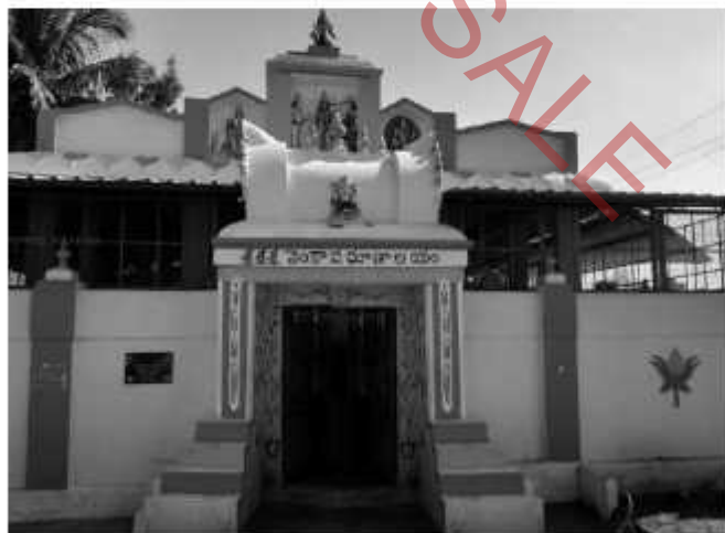
ஸ்ரீ வெங்குசா மகராஜ் அவர்களின் மகாசமாதி மந்திர வெளித்தோற்றம் சத்தகுரு திருவடி சூணம்